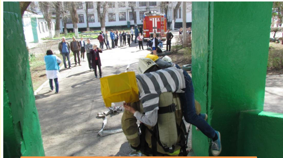
«Джанкойская санаторная школа-интернат »