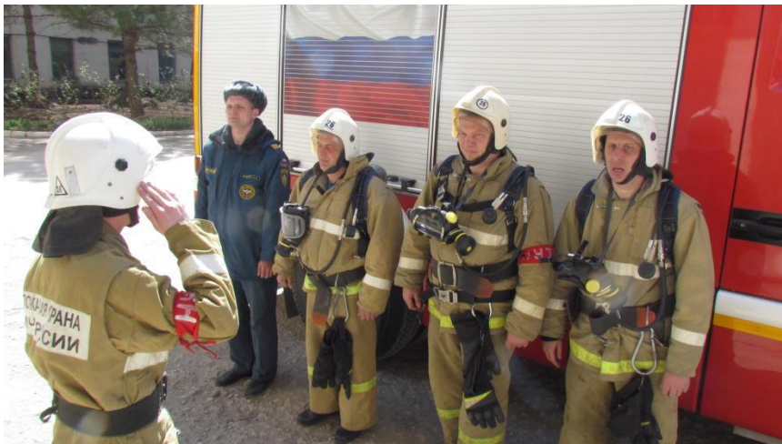
«Джанкойская ЦРБ »