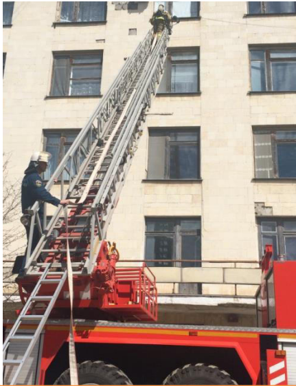
«Джанкойская ЦРБ »

проведения ПТЗ на СЗО с ночным пребыванием людей в зоне обслуживания 6 ПСО ФПС по Республике Крым 04.03.2018г.