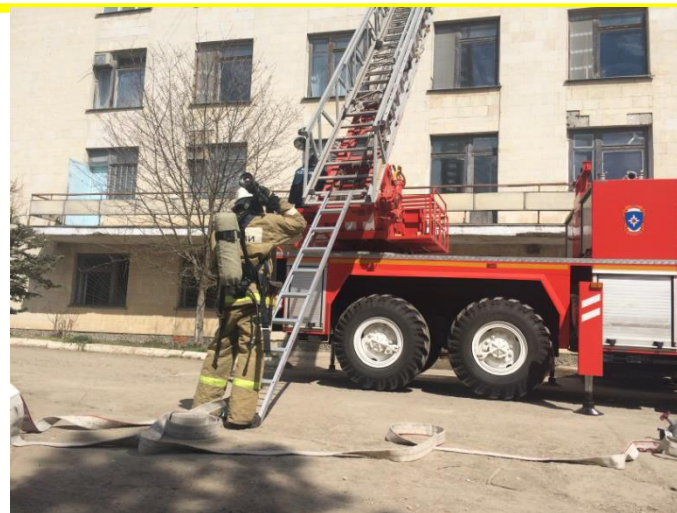
Джанкойская ЦРБ Акушерское физиологическое отделение »