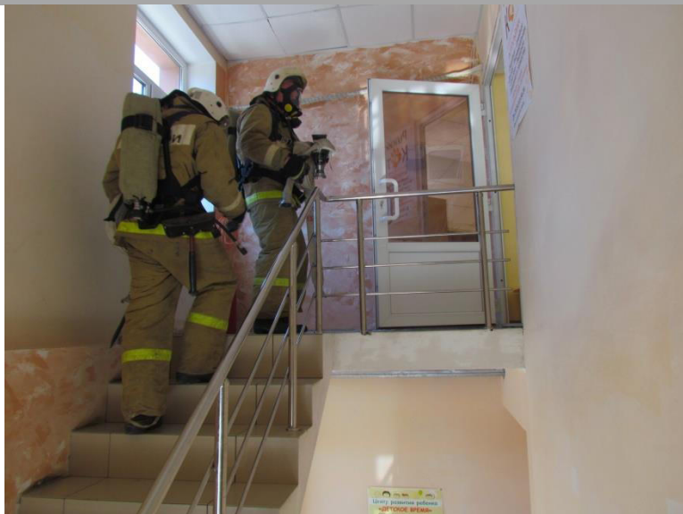
Джанкойская ЦРБ Акушерское физиологическое отделение »

проведения ПТЗ на СЗО с ночным пребыванием людей в зоне обслуживания 6 ПСО ФПС по Республике Крым 04.03.2018г.