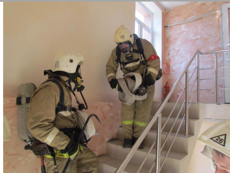
Джанкойская ЦРБ Акушерское физиологическое отделение »