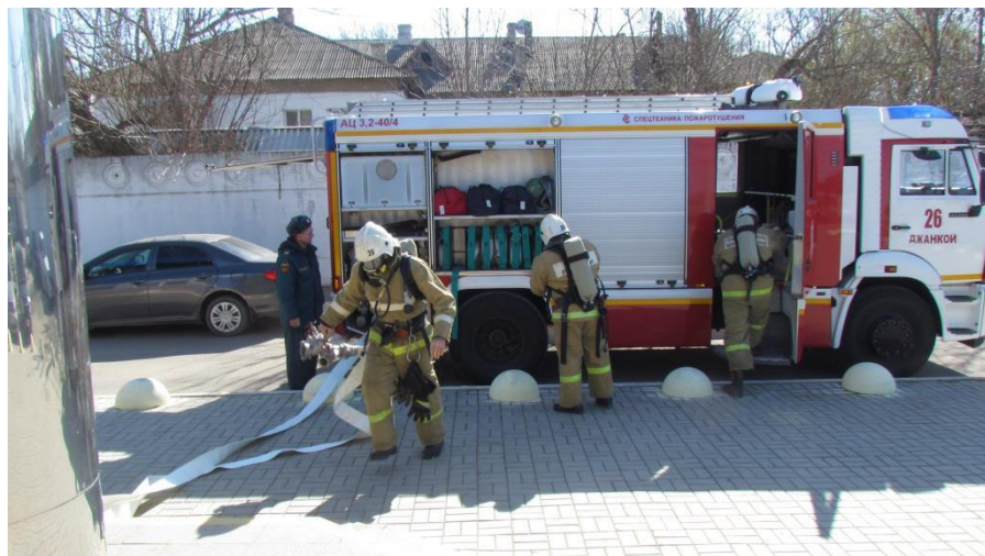
Джанкойская ЦРБ Акушерское физиологическое отделение »