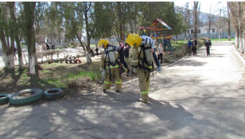
«Джанкойская санаторная школа-интернат »

проведения ПТЗ на СЗО с ночным пребыванием людей в зоне обслуживания 6 ПСО ФПС по Республике Крым 04.03.2018г.