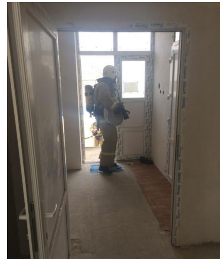
«Джанкойская ЦРБ »