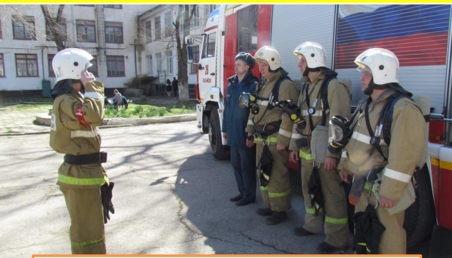
«Джанкойская санаторная школа-интернат »